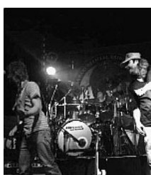
Ma Noi No

Stasera alla Festa Pd Casalgrande a Villalunga omaggio alla musica de I Nomadi con Ma Noi No in concerto. L'intento del gruppo - nato fra Reggio e Parma nel 2003 - è quello di riproporre la musica dei Nomadi in nome del indimenticato Augusto Daolio