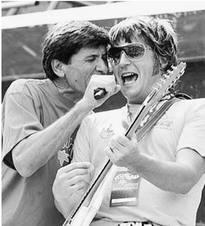
Bengi dei Ridillo con Gianni Morandi

È infatti in rotazione nelle radio il nuovo singolo "Stop alle telefonate", che anticipa un album in uscita a settembre e contiene tutti gli elementi caratteristici che rappresentano il marchio di una delle party band più efficaci in circolazione: una solida base dance pie-