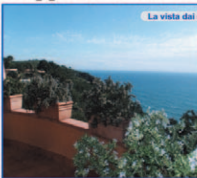
La vista dai nostri terrazzi

Tutti gli appartamenti hanno Vista Mare-giardino privato-posto auto-ingresso indipendente. Oltre 60.000 mq di macchia mediterranea condominiale Sentiero pedonale per discesa al mare-pronta consegna.